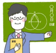
がっこう せんせい 学校の先生など