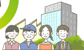
みせ かいしゃ お店・会社など