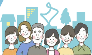
きんじよ ひと 近所の人たち