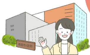
まちだしやくしよ 町田市役所