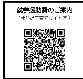
就学援助費のご案内 (まちだ子育てサイト内)

電車でお越しの方 JR横浜線 町田駅中央口徒歩11分 小田急線 町田駅西口徒歩8分 バスでお越しの方 「町田市役所市民ホール前」下車徒歩1分 車でお越しの方 立体駐車場をご利用ください。