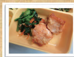
簡単給食 大分名物・とり天 (3月10日実施メニュー)