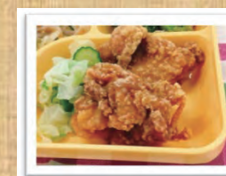
簡単給食 人気No.1★鶏の唐揚げ (3月18日実施メニュー)

町田市は、生涯にわたって中断のない食育を推進しています。この食育推進の一環として、料理レシピサイト『クックパッド』で、小学校や中学校、保育園などの給食のレシピの提供を行っています。町田市おススメのレシピを、192レシピ(※)公開中!ぜひ、日々の食事づくりの参考にしてください!