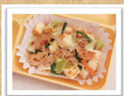
簡単給食 キムチ豆腐 (3月3日実施メニュー)