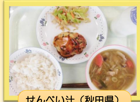
せんべい汁 (秋田県)

その日の給食を紹介するお便りです。子供たちからは感想が届きます。感想には、栄養士から返事を書いて学級へ戻しています。