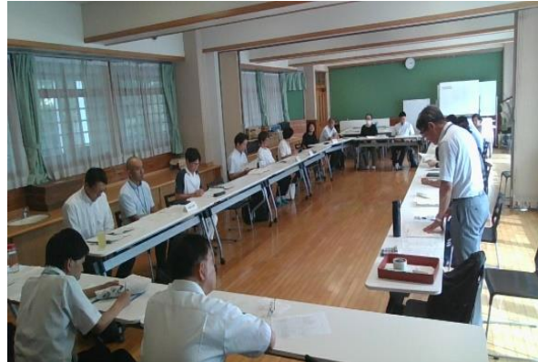
第7地区ミーティングの様子