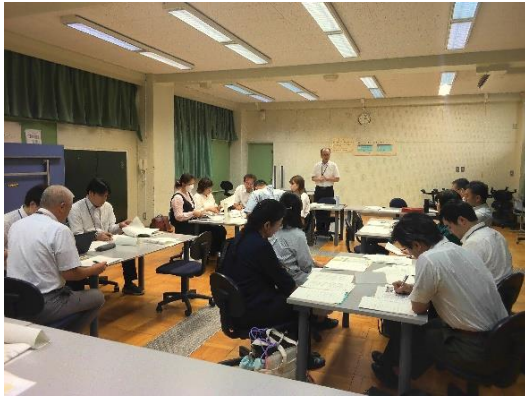
第1地区ミーティングの様子