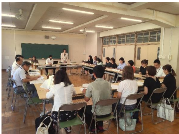
第6地区ミーティングの様子