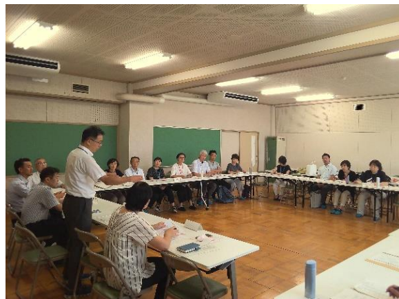
第8地区ミーティングの様子