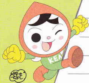
じんけん 人権イメージ キャラクター 「人KENまもる君」

こえ だ い ほか ひと はな 声に出して言えないこと、他の人に話しぶらいことって あるよね。でも、てがみ ことば 手紙だったら、言葉にはできないことも、 か ゆうき だ 書けたりしない？ちょっとだけ、勇気を出して、 みんなのこころの声を聞かせてください。 こま たす 困っているみんなの、きっと、きっと、助けになるから。