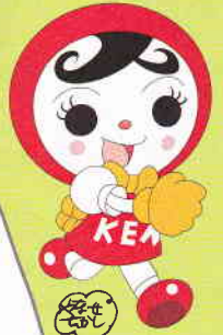
じんけん 人権イメージ キャラクター 「人KENあゆみちゃん」

こえ だ い ほか ひと はな 声に出して言えないこと、他の人に話しぶらいことって あるよね。でも、てがみ ことば 手紙だったら、言葉にはできないことも、 か ゆうき だ 書けたりしない？ちょっとだけ、勇気を出して、 みんなのこころの声を聞かせてください。 こま たす 困っているみんなの、きっと、きっと、助けになるから。