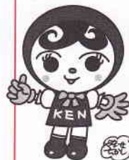
人権イメージキャラクター「人KENあゆみちゃん」

4 書いたメッセージをお折り、封筒に入れて封をしたら、ポストに投函してください。