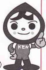
人権イメージキャラクター「人KENまもる君」