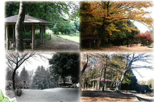
展望広場「六角亭」付近の四季

市街地から「かしの木山」を望む。町田市成瀬、高ヶ坂、南大谷にまたがる約5.5ヘクタールの自然の宝庫。まさに緑のオアシス。