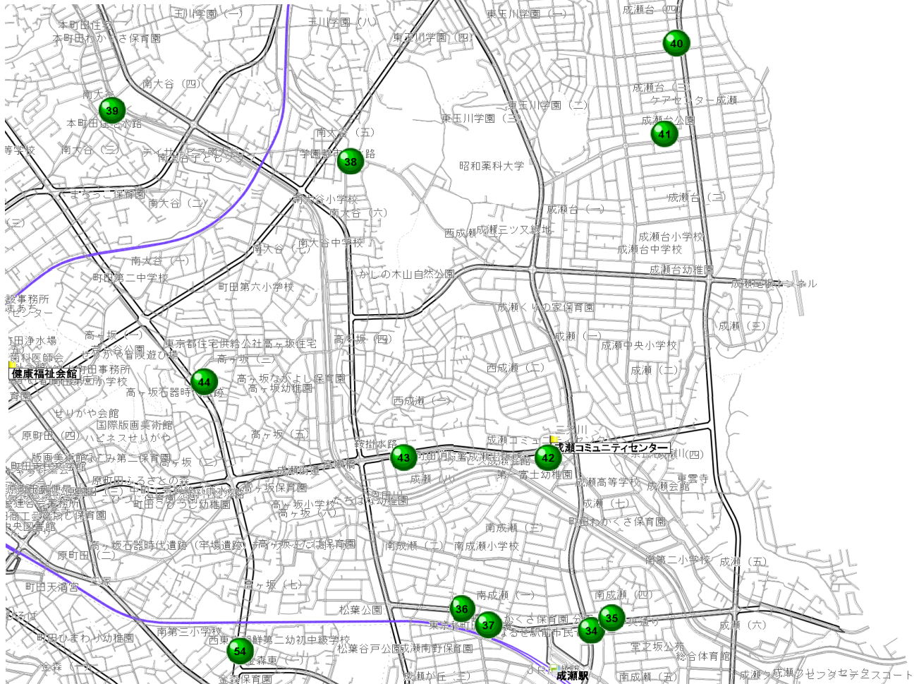
【各歯科医院の案内地図】