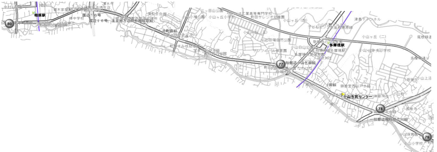
【各歯科医院の案内地図】