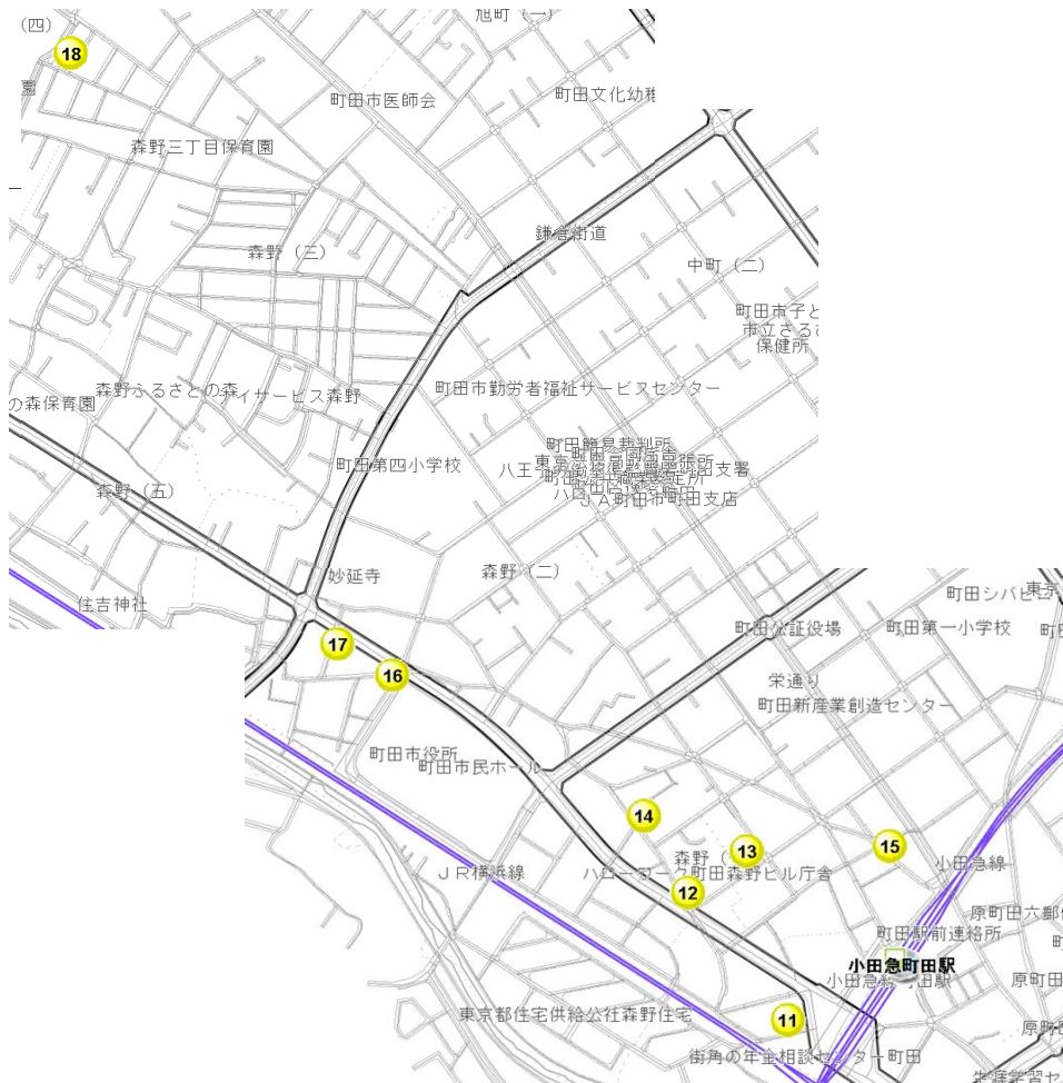
【各歯科医院の案内地図】

※診療時間・休診日は変更になる場合がございます。事前にお問い合わせの上、受診してください。 ※治療の内容や、フッ化物の種類、料金は歯科医院によって異なります。直接、歯科医院へご相談ください。 ※予防歯科の年齢、フッ化物配合歯磨き剤推奨年齢、歯科治療実施年齢はおおよそのめやすです。 お子さんによって異なる場合がありますので歯科医院でご相談ください。 ※（矯）は矯正歯科です。