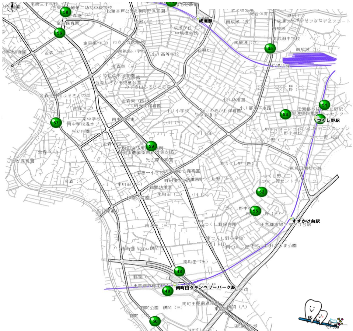
【各歯科医院の案内地図】