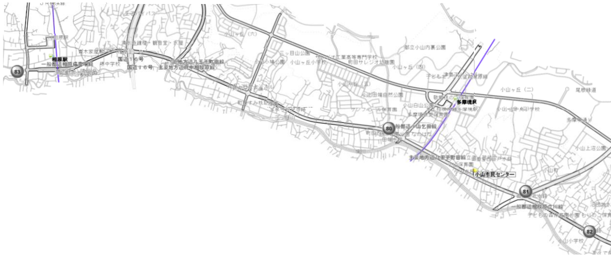
【各歯科医院の案内地図】