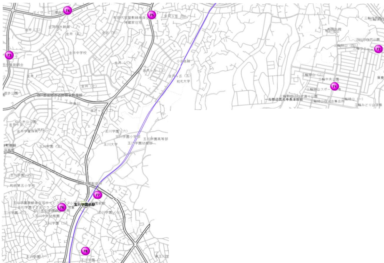
【各歯科医院の案内地図】

※診療時間・休診日は変更になる場合がございます。事前にお問い合わせの上、受診してください。