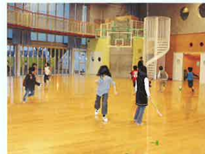
ふらっぶ (プレイルーム)