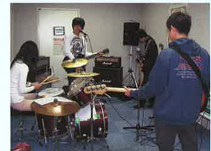
スタジオみらい (音楽室)