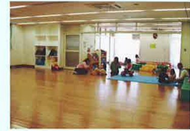
びゅあ (多目的室、乳幼児コーナー)