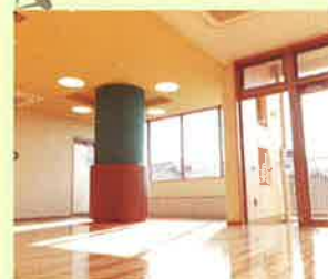
乳幼児室 はぐはぐ