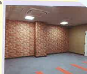
スタジオ ふあんふあん