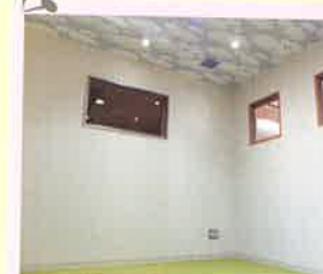
読み聞かせコーナー よみよみ