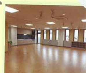
創作アトリエとんとん 調理室ことこと