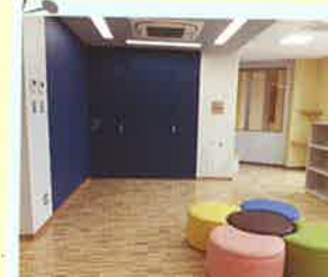
図書コーナー ふむふむ