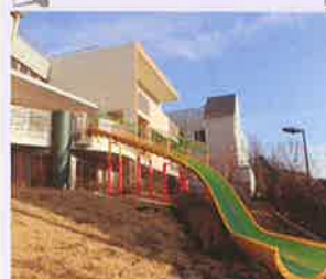
テラスぐるぐる・すべり台