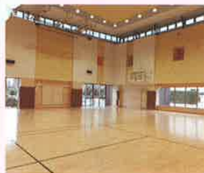
プレイルーム わいわい