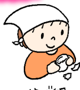
ゆで卵のからむき