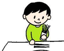
お皿やお箸を並べる