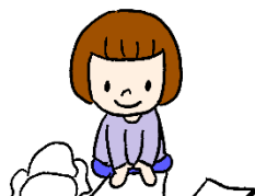
タオルやハンカチをたたむ