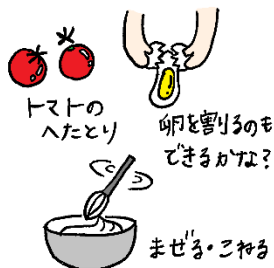
トマトのへたとり