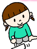
粘着ローラーでコロコロ